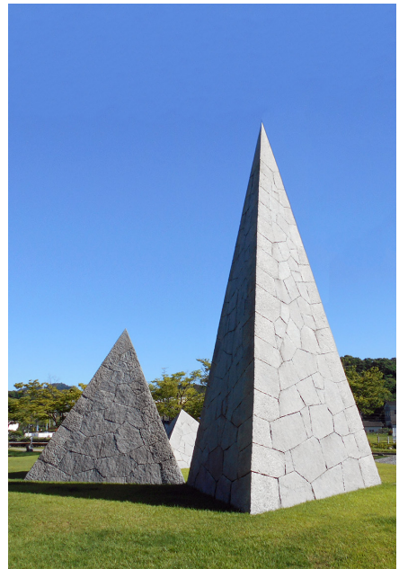
ほし うら 星の浦海浜公園 (今治市)