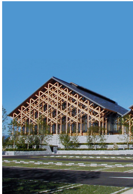
えひめ まつやま 愛媛県武道館 (松山市)

身のまわりには、形に着目するといろいろな立体としてみる事ができるものがあります。どのような形があるかを見つけ、その形の とくちよう 特徴について考えてみましょう。(愛媛県)