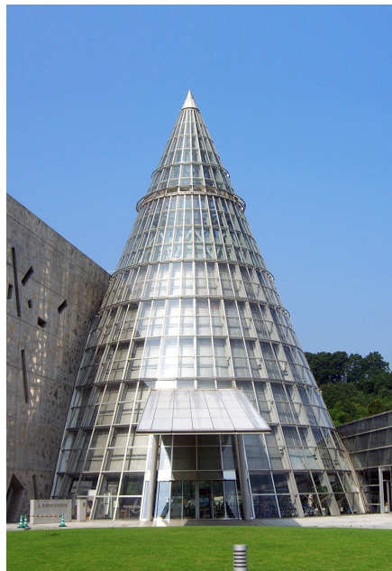
えひめ にいはま 愛媛県総合科学博物館 (新居浜市)