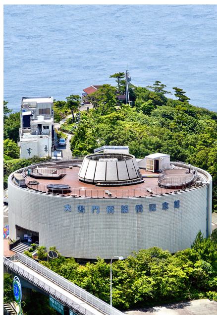
おおなるとまきょうかきょう 大鳴門橋架橋記念館 (鳴門市)