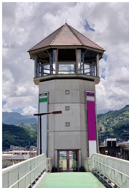
道の駅 さだみつ 貞光ゆうゆう館 (美馬郡つるぎ町)