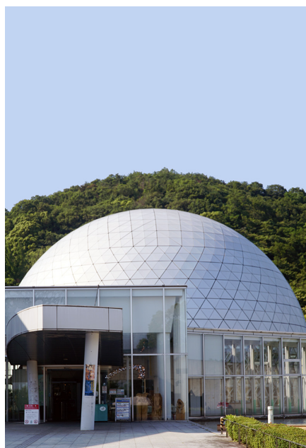
あすたむらんど徳島 とくしま (徳島県子ども科学館) いたの (板野郡板野町)