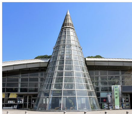
いばら なぬかいち 井原駅*1 (井原市七日市町)

身のまわりには、形に着目するといろいろな立体としてみる事ができるものがあります。どのような形があるかを見つけ、その形の とくちよう 特徴について考えてみましょう。 (岡山県)