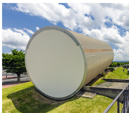
なぎ かつた 奈義町現代美術館*2 (勝田郡奈義町)