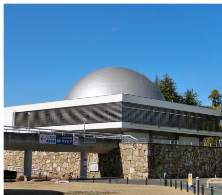
おかやま きた 人と科学の未来館サイピア (岡山市北区)