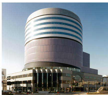
岡山シンフォニービル*3 (岡山市北区)