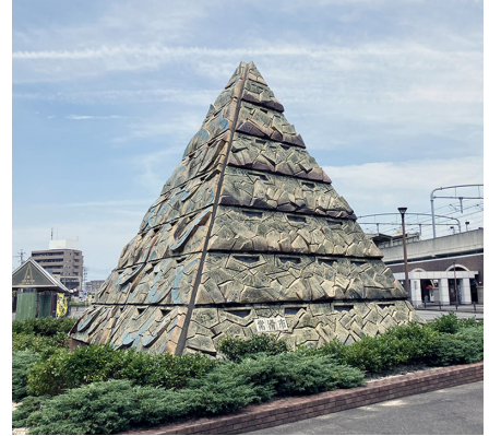
とこなめ 常滑駅前 フューチャードリーム 未来の夢 (常滑市鯉江本町)