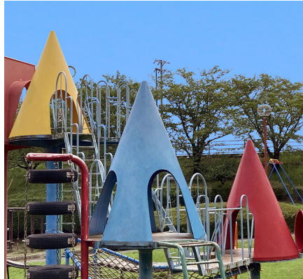
ななまがり ちた やわた 七曲公園遊具 (知多市八幡)