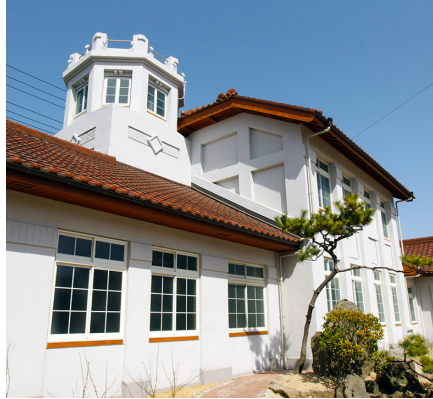
きゅうおおはまけいさつしよ へきなん にしき 旧大浜警察署*1 (碧南市錦町)

身のまわりには、形に着目するといろいろな立体としてみる事ができるものがあります。どのような形があるかを見つけ、その形の 特徴 とくちょう について考えてみましょう。 (愛知県)