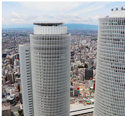
なごや なかむら JR セントラルタワーズ (名古屋市 中村区)