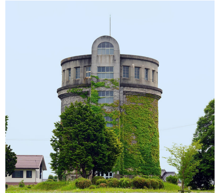
おかざき ろつく とう 岡崎市六供配水場配水塔 (岡崎市六供町)