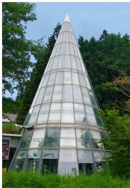
しもたかい やまのうち クリスタルテラス*2 (下高井郡山ノ内町)