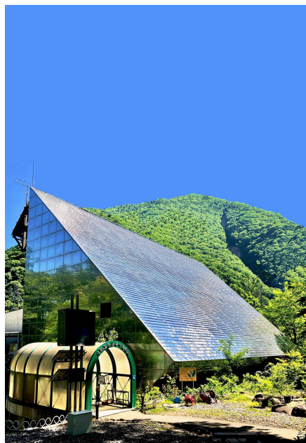
おあまち たいら 大町エネルギー博物館*1 (大町市平)

身のまわりには、形に着目するといろいろな立体としてみる事ができるものがあります。どのような形があるかを見つけ、その形の 特徴 とくちょう について考えてみましょう。 (長野県)