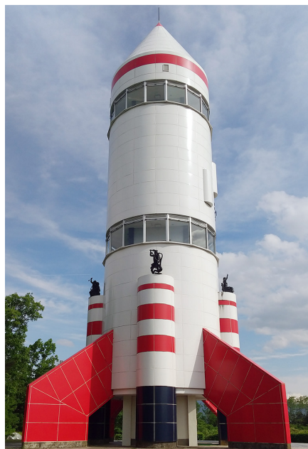
いなりやま さく かづま 稲荷山公園 コスモタワー展望台 (佐久市勝間)