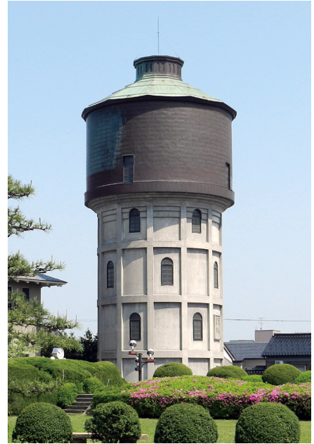
しみず はいすいとう たかおか 清水町配水塔資料館旧配水塔 (高岡市清水町)