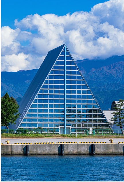
うおづまいぼつりん しやかどう 魚津埋没林博物館 (魚津市釈迦堂)