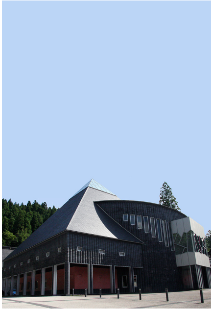
たてやま なかにいかわ 富山県 [立山博物館] ※1 (中新川郡立山町)