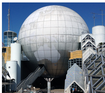
しょうなんだい 湘南台文化センター (藤沢市湘南台)