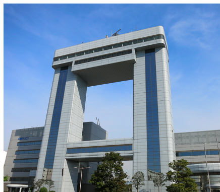
かわさき 川崎マリエン (川崎市川崎区)