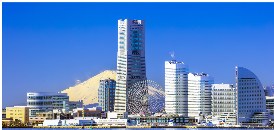
よこはま 横浜みなとみらい 21 (横浜市西区・中区)