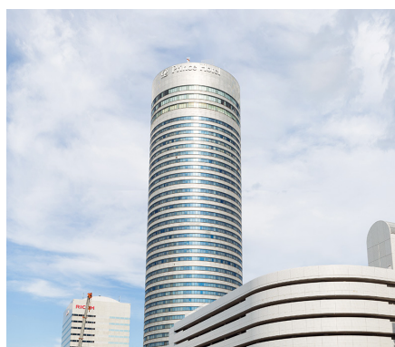
しんよこはま 新横浜プリンスホテル (横浜市港北区)